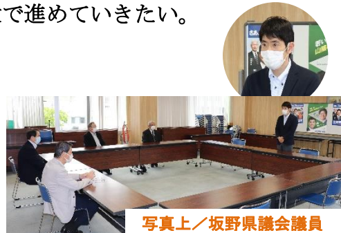
写真上/坂野県議会議員